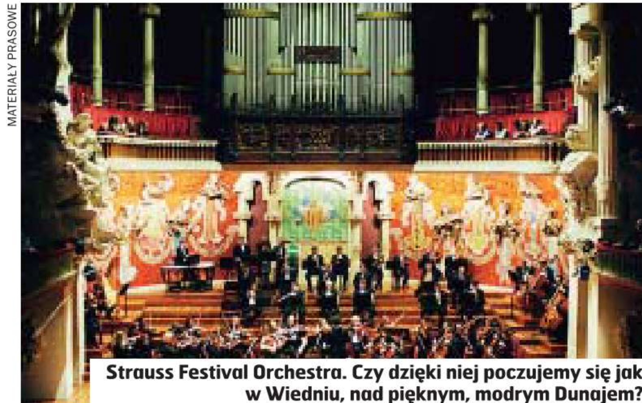
Strauss Festival Orchestra. Czy dzięki niej poczujemy się jak w Wiedniu, nad pięknym, modrym Dunajem?